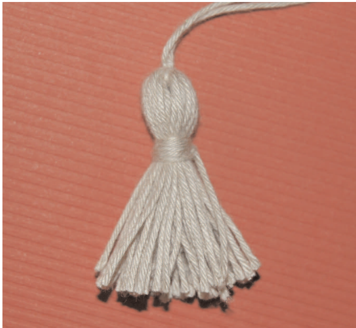
Pompons en coton (environ 4 cm)